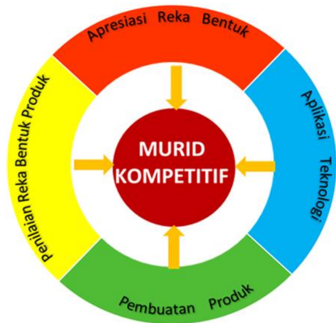
Rajah 2: Domain Reka Bentuk dan Teknologi

KSSR RBT (Semakan 2017) memberi fokus kepada empat domain iaitu apresiasi reka bentuk, aplikasi teknologi, pembuatan produk dan penilaian reka bentuk produk seperti dalam Rajah 2. Murid mengaplikasikan pengetahuan dan kemahiran melalui aktiviti mereka bentuk dan menghasilkan produk yang bermakna. Penerangan setiap domain adalah seperti dalam Jadual 1.