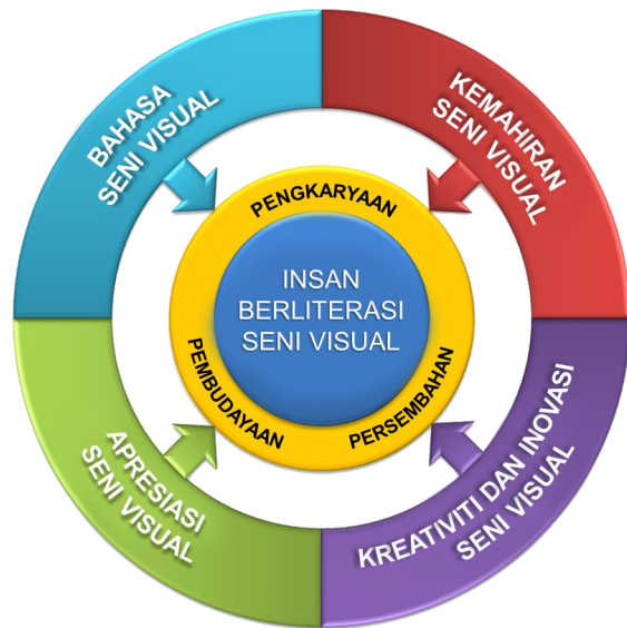
Rajah 2: Model KSSR Pendidikan Seni Visual

KSSR Pendidikan Seni Visual memberi fokus kepada pembinaan insan berliterasi seni menerusi aktiviti pengkaryaan, pengurusan dan pembudayaan seni. Bagi mencapai hasrat ini, KSSR Pendidikan Seni Visual digubal dengan berasaskan empat modul kurikulum seperti di Rajah 2.