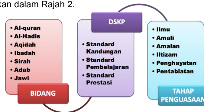
Rajah 2: Organisasi Kandungan dalam Kurikulum Pendidikan Islam

Kandungan Pendidikan Islam boleh dikembangkan melalui proses p&p yang dijalankan sehingga murid berkebolehan mencapai tahap-tahap penguasaan yang ditetapkan dalam Pendidikan Islam iaitu ilmu, amali, amalan, iltizam, penghayatan dan pentabiatan. Enam Tahap Penguasaan tersebut merupakan indeks kemenjadian murid yang dihasratkan dalam kurikulum Pendidikan Islam. Organisasi kandungan dalam kurikulum Pendidikan Islam dapat ditunjukkan dalam Rajah 2.